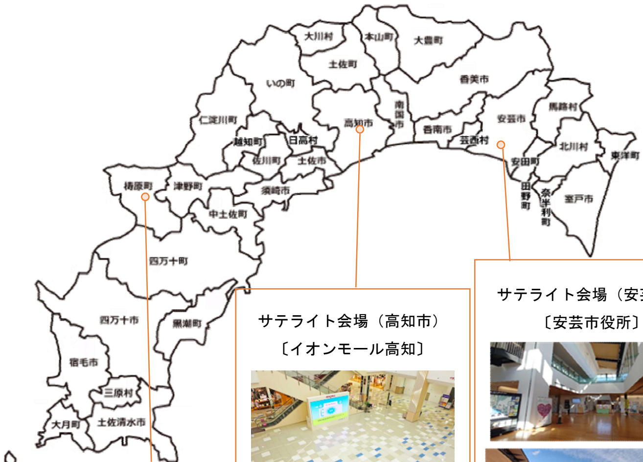
サテライト会場（安芸市） 〔安芸市役所〕