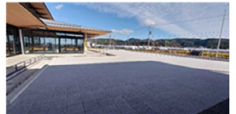
サテライト会場（高知市） 〔イオンモール高知〕